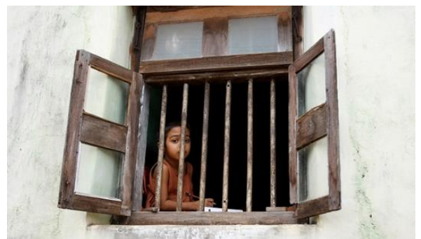
Orphelinat en Roumanie